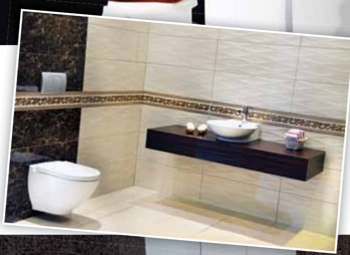
Seramik: Emperador Serisi SSG: Harmony Serisi

Ürün gamına her yıl 30 ürün eklediklerini vurgulayan Savcı: "2013 yılında duvar ve yer karolarının yanısıra seramik sağlık sektöründe yeni tasarımlarımızı çıkararak, dekorasyonda modanın belirleyicisi olmaya devam edeceğiz. 2012'de toplam 35 milyon Euro değerinde sırlı porselen ve yer karosu fabrikasına yatırım yaptık. İhracat ciromuz ise 25 milyon dolar oldu. 2013'teki hedefimiz iç ve dış satışlar toplamı 130 milyon dolarlık ciroya ulaşmak." diye konuştu.