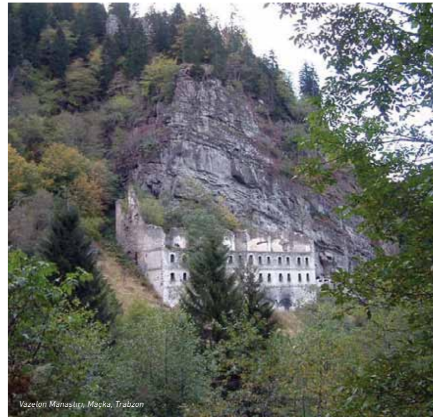
Vazelon Manastırı, Maçka, Trabzon

Doğu Karadeniz doğal, kültürel ve tarihi değerlerinin yanı sıra henüz tam anlamıyla turizmin hizmetine sunulmamış varlıklarıyla da ilgi çekiyor. Vazelon Manastırı, Trabzon'un Maçka ilçesine 14 kilometre uzaklıkta Kiremitli köyü sınırları içinde, bir