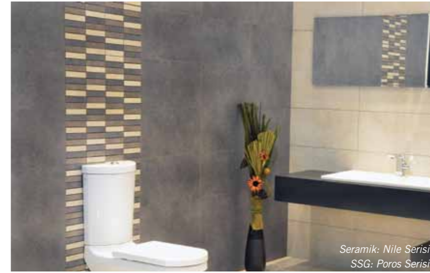
Seramik: Nile Serisi SSG: Poros Serisi