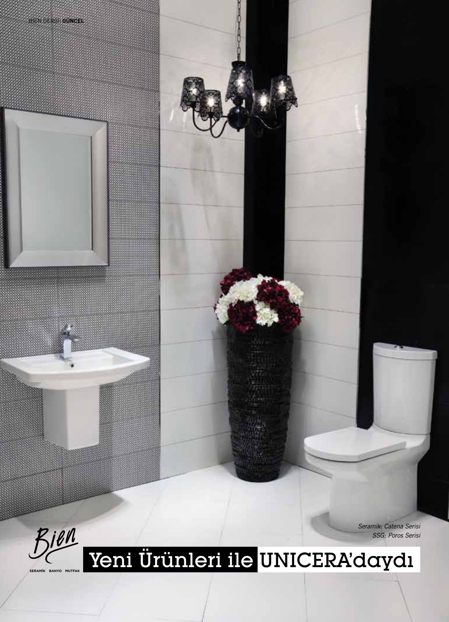
Seramik: Catena Serisi SSG: Poros Serisi