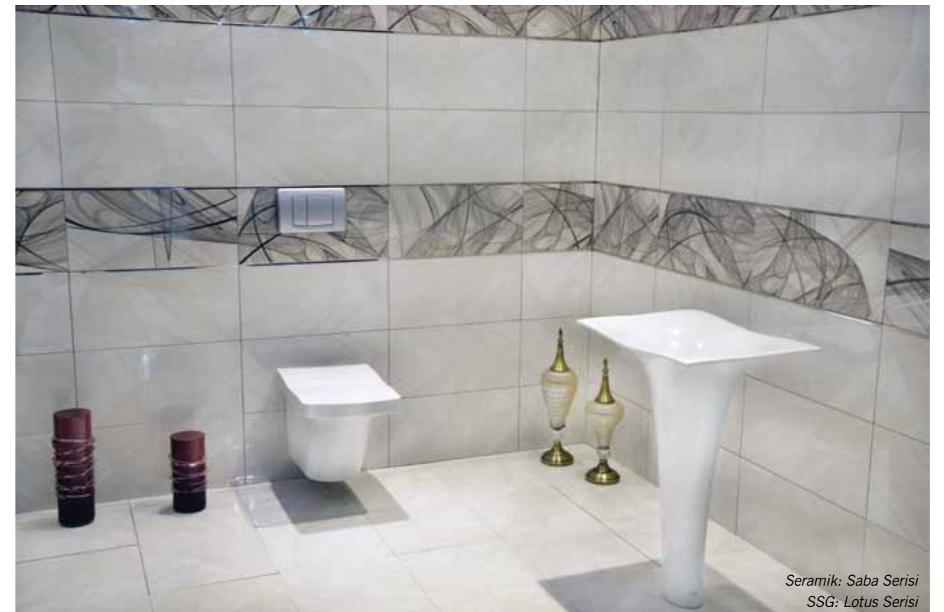
Seramik: Saba Serisi SSG: Lotus Serisi