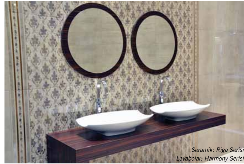
Seramik: Riga Serisi Lavabolar: Harmony Serisi