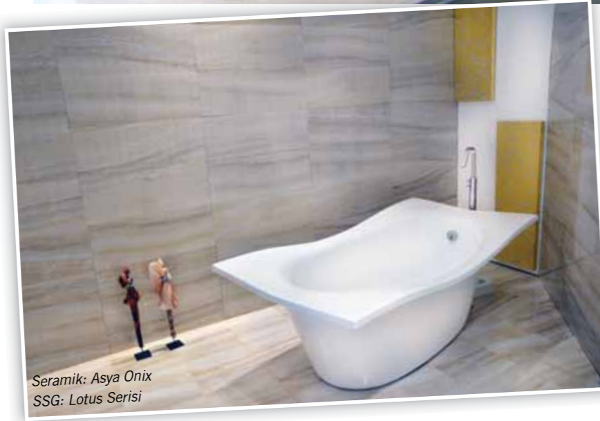
Seramik: Asya Onix SSG: Lotus Serisi