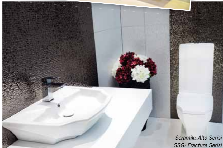
Seramik: Alto Serisi SSG: Fracture Serisi

Bien, seramik ve seramik sağlık gereçleri ürünlerini UNICERA Fuarı'nda 3 hol 321 no'lu standta sergiledi. Dünyada kullanılan en son teknolojiye göre seçilen robotlu yüksek basınçlı döküm sistemleri, robot sırlamalar ve robot taşlama makineleri ile üretilen Se-