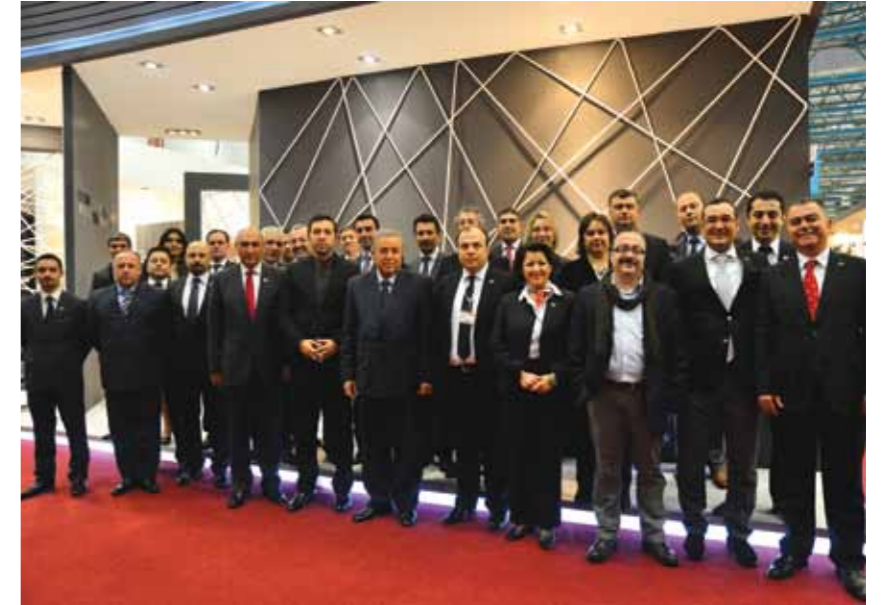
Bien ekibi UNICERA Fuarı'nda hep beraber.