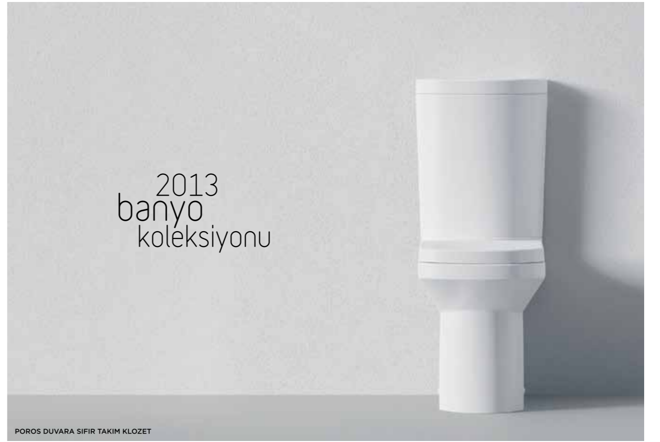
POROS DUVARA SIFIR TAKIM KLOZET

YURT DIŞINDA ŞU ANA KADAR BİRİ ALMANYA'DA BİRİ GÜRCİSTAN BATUM'DA OLMAK ÜZERE İKİ SHOWROOM AÇTIK. 2013 YILINDA SHOWROOM SAYIMIZI 5'E, 2014 YILINDA DA 10'A ÇIKARTMAYI PLANLIYORUZ.