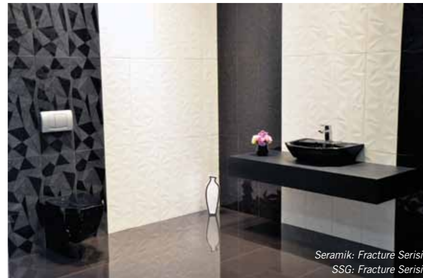
Seramik: Fracture Serisi SSG: Fracture Serisi